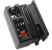
Eurocode 019649 Chargeur batterie PULSA / ST400i