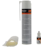
Eurocode 013690 Kit de nettoyage IMPULSE / PULSA