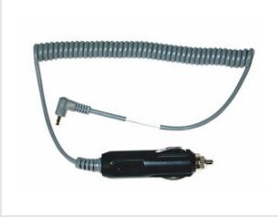
Eurocode 900507 Adaptateur de voiture