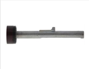
Eurocode 014641 Ens. porte rondelle P800-P40