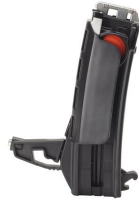
Eurocode 019337 Magasin 20 clous PULSA 40