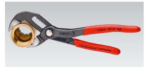
Mini Cobra: En format de poche avec toutes les fonctions de la Cobra. Capacité jusqu'à Ø 30 mm