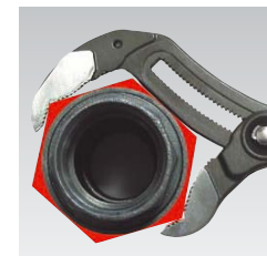
Cobra XL (longueur 400 mm) dépasse grâce à l'ouverture de ses mâchoires jusqu'à 95 mm l'efficacité d'une clé serre-tubes de la même longueur