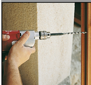
1. Percer la menuiserie au Ø8 mm