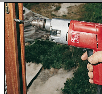
4. Visser et c'est fini !