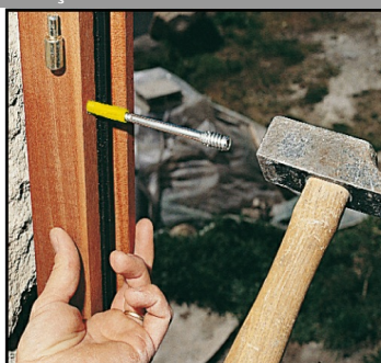
3. Enfoncer la vis montée sur la cheville dans la menuiserie