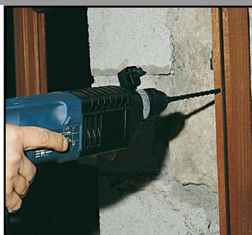
2. Percer un trou Ø8 mm dans le mur au travers de la menuiserie