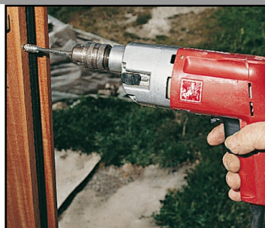
2. Visser et c'est fini !