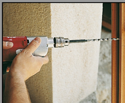
1. Percer la menuiserie au Ø8 mm