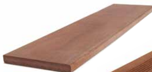
4 faces lisses