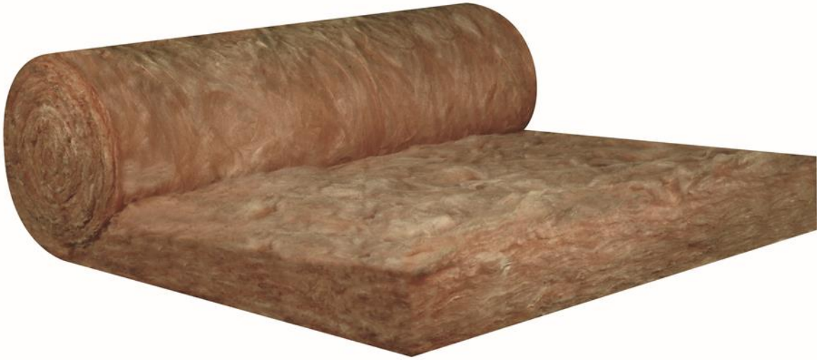
Knauf Insulation Laine de verre ECOSE Technology® KI Fit 032 120 mm