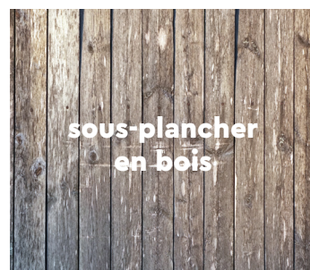
sous-plancher en bois

Vérifiez le support pour détecter la présence de problèmes d'humidité. Ne superposez en aucun cas les joints du nouveau revêtement de sol sur ceux du carrelage existant. Il n'est pas nécessaire de combler les joints d'un carrelage existant si ceux-ci ne dépassent pas 5 mm de large. Rappelez-vous que certains carrelages peuvent présenter des parties saillantes bien que le nivellement général soit correct. Ces aspérités peuvent se voir ultérieurement au travers du nouveau revêtement.