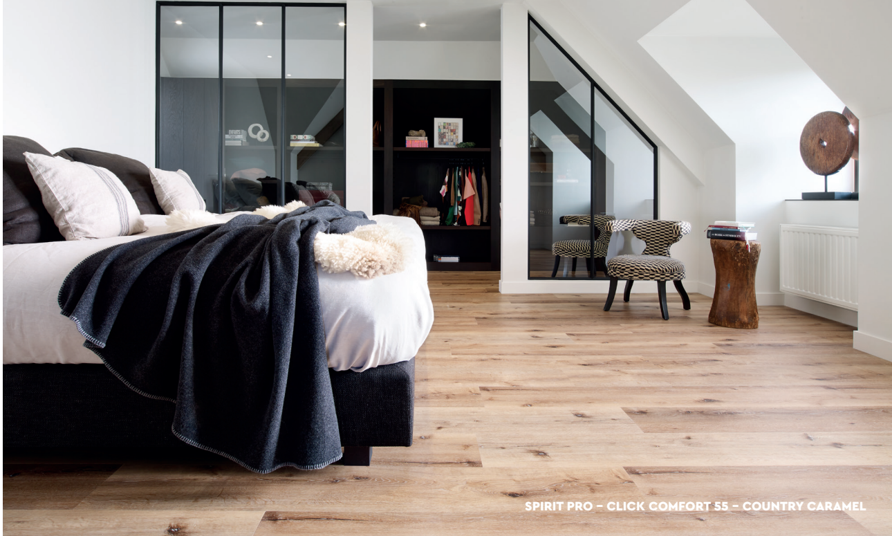
SPIRIT PRO – CLICK COMFORT 55 – COUNTRY CARAMEL