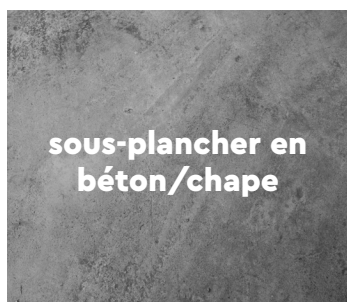
sous-plancher en béton/chape

Laissez sécher suffisamment le nouveau béton. L'humidité contenue dans le support doit être inférieure à 75% HR à 20°C minimum. Ne dépassez pas un taux d'humidité maximum de 2% CM pour le ciment et de 0,5% pour les chapes anhydrites. En cas de chauffage par le sol, le taux d'humidité doit être inférieur à 1,8% CM et à 0,3% CM pour les chapes anhydrites. Prenez toujours note des données relatives au taux d'humidité et conservez-les.