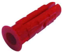
Cheville Tampon pour patte à vis