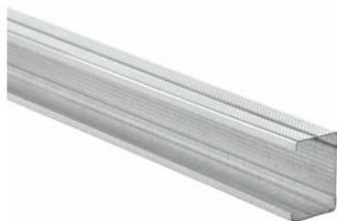
Figure 1: Visuel des profilés du groupe