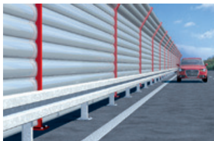
Glissières de sécurité et murs anti-bruit