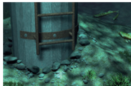
Utilisations sous l'eau