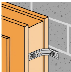
Fixation bois/ support rigide