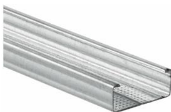
Figure 1: Visuel des profilés du groupe