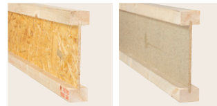
âme OSB/3 âme P5