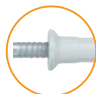
Versión douille fraisée