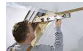
Définir le gabarit de coupe en fonction de la pente du toit.