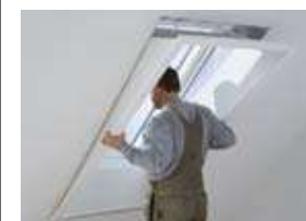
Mise en place de l'habillage sur l'encadrement.