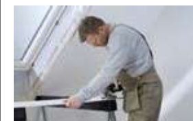
Découpe et adaptation de l'habillage.