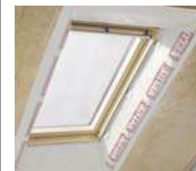
Installation de la colerette BBX.