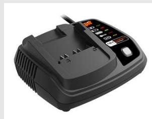
Eurocode 054552 Chargeur compact 18V