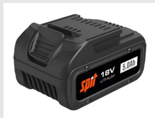
Eurocode 054551 Batterie 18V - 5Ah