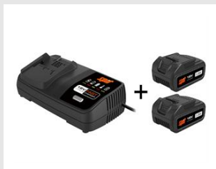
Eurocode 054548 Pack énergie 18V - 5Ah