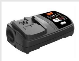
Eurocode 054553 Chargeur rapide 18V