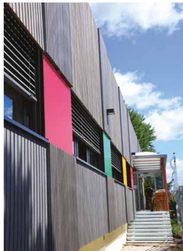
Cetic (71) — Bardage en peuplier THT - Finition Rubio Monocoat® gris vieux bois - Architecte Olivier Le Gallée