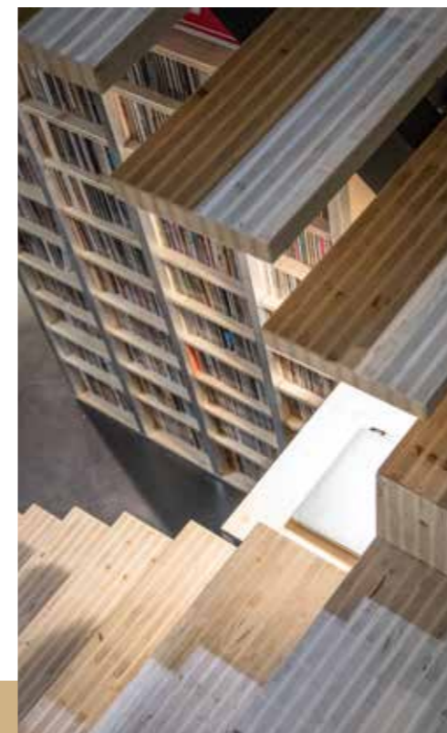
Escalier et bibliothèque en panneau YD-WOODS