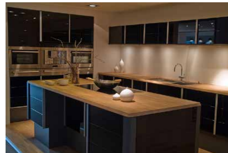
Plan de travail de cuisine en panneau lamellé-collé - Patchwood chêne