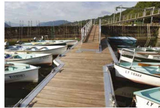
Ponton du Lac du Bourget (73) — Platelage chêne naturel classe 4