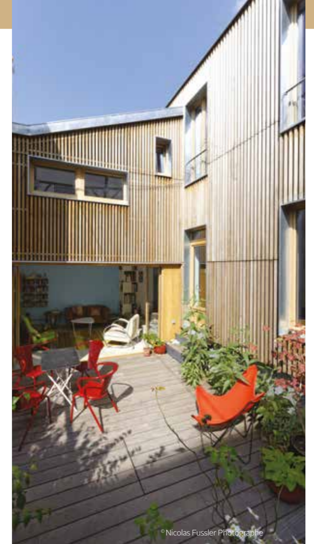
Pré St-Gervais (75) — Bardage en peuplier THT Côtéparc® Verdier-Rebière Architectes