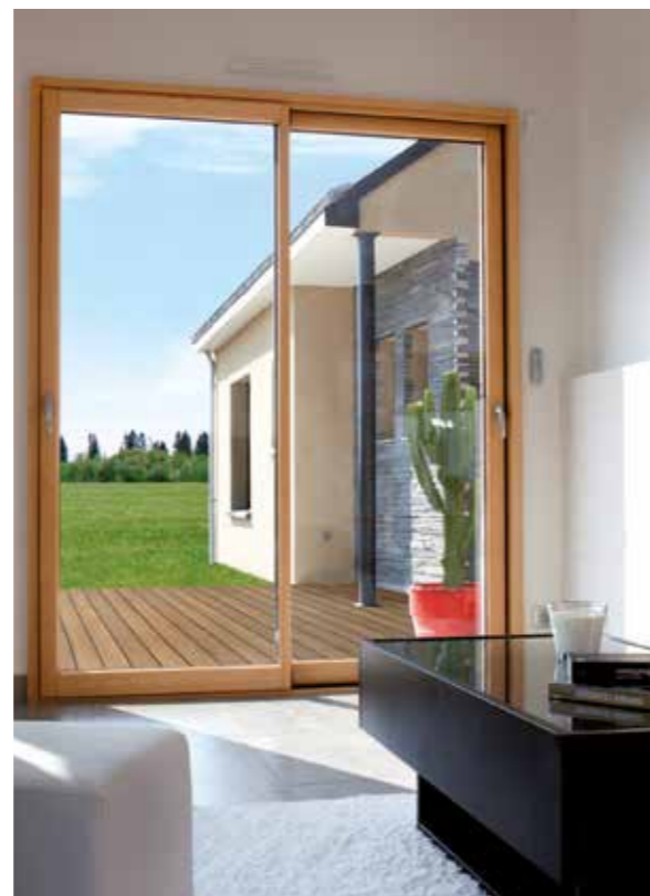
Fenêtre mixte bois-alu : Carrelet chêne Profileo®