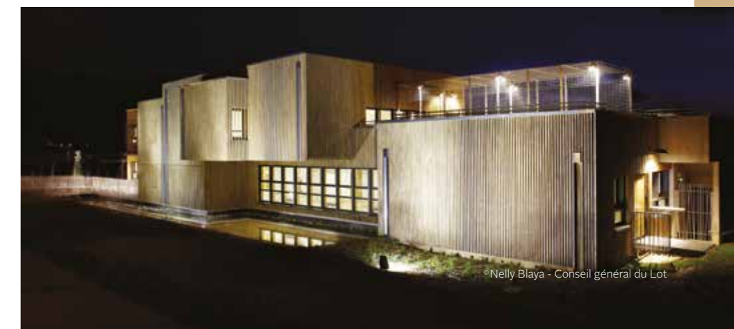
Maison du département du Lot (46) — Bardage en chêne naturel abouté Architecte Philippe Berges