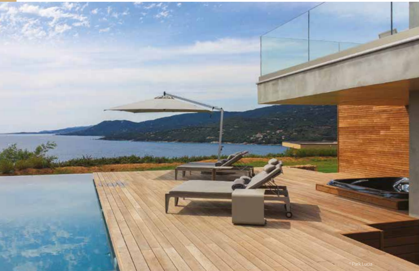
Casa Lucia (20) — Terrasse et bardage en frêne THT Côtéparc®