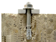
Goujon fileté Inox - vue en coupe