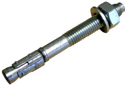
Goujon fileté Inox