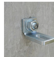
Goujon fileté Inox - vue en situation