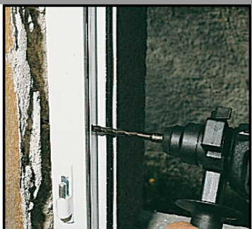
2. Percer un trou \varnothing 8 mm dans le mur au travers de la menuiserie