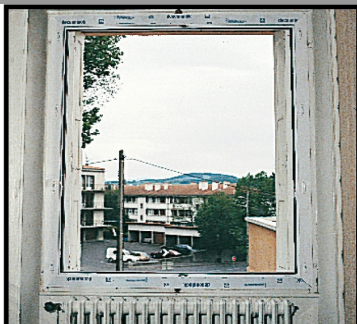
2. Positionner la menuiserie d'aplomb et de niveau après avoir préparé le dormant.