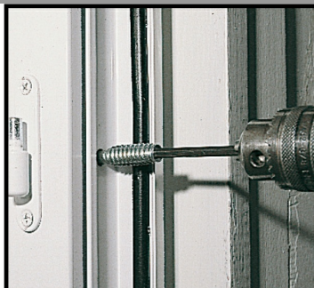
3. Enfoncer la vis dans la menuiserie et visser.