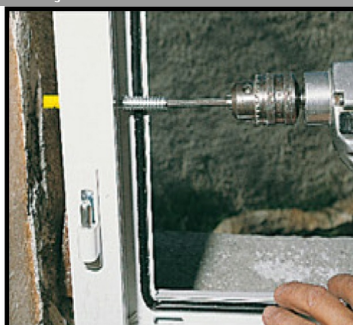
3. Enfoncer la cheville + la vis au travers de la menuiserie puis visser.