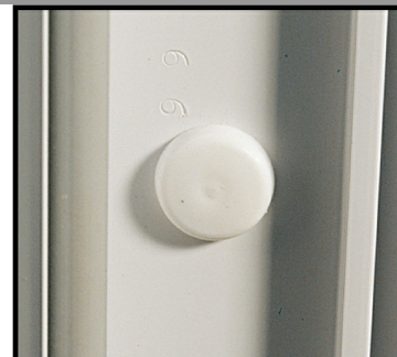
4. Mettre en place le capuchon orientable c'est fini !