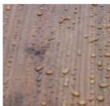
PROTÉGÉ PAR LE SYSTÈME ANTI-UV