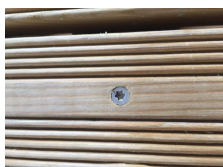
4. Huit nervures sous tête pour une finition parfaite