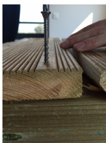
2. Débourage et rapidité de fixation