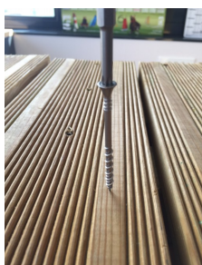
1. Meilleure pénétration, pointe effilée.