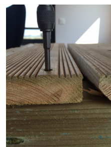
3. Plaquage de la lame sur la lambourde