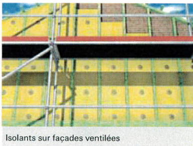
Isolants sur façades ventilées