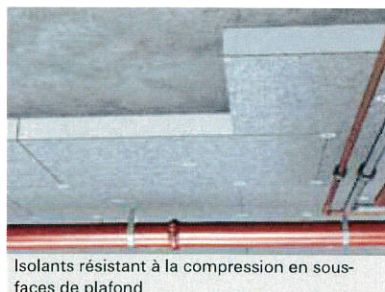
Isolants résistant à la compression en sous-faces de plafond