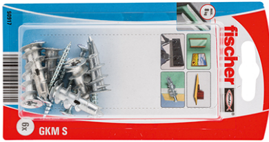
Cheville pour corps creux GKM et vis